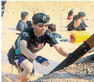
▲參賽者將時下流行的運動攝像機安裝在頭部，記錄自己“爬山涉水”的難得時刻。