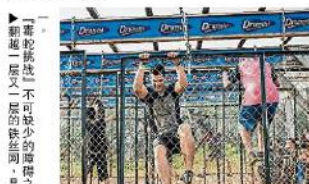
▲“毒蛇挑戰”不可缺少的障礙之一，翻越一層又一層的繩索網。

▲參賽者臥虎藏龍 前 來征戰“毒蛇挑戰”的參賽者們可說是虎虎威風，許多人不但过关斬將，有些不到两个小时就抵達終點！