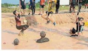
▲突破繩索在繩索頂端的鉤環，才算完成“繩網”(ropes climb)关卡挑戰。