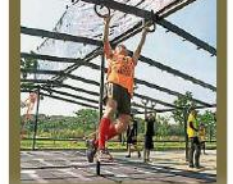
▲最後一關障礙必須以圓環套上單杠的鉤頭，小心翼地翻過單杠。