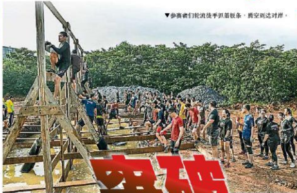
▼參賽者們轮流徒手抓著鐵條，騰空到達對岸。